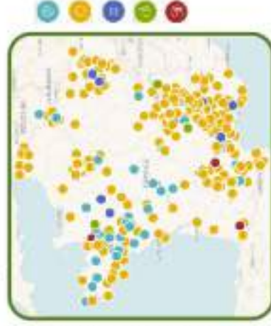
Carte des projets EnR citoyens - Energie Partagée